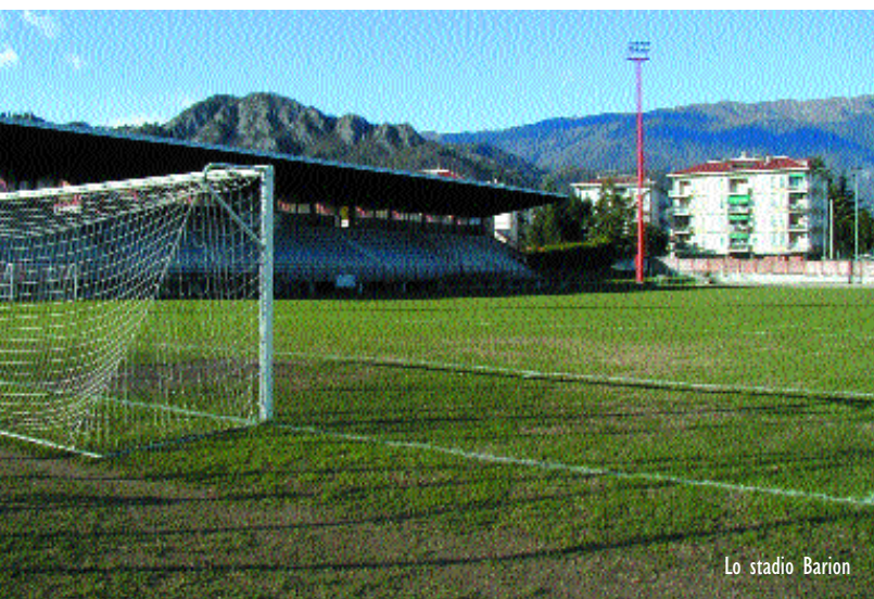
Lo stadio Barion