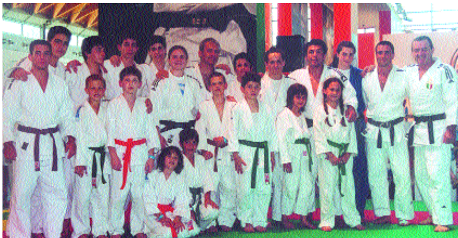
I judoka vittoriesi in stage a Rimini con l'olimpionico Pino Maddaloni

Un grande "in bocca al lupo" alla fine se lo meritano perché al di là dell'indiscutibile bravura, riusciranno ancora una volta a portare l'attenzione dello sport Nazionale sul nome della città di Vittorio Veneto che onorano e rappresentano.