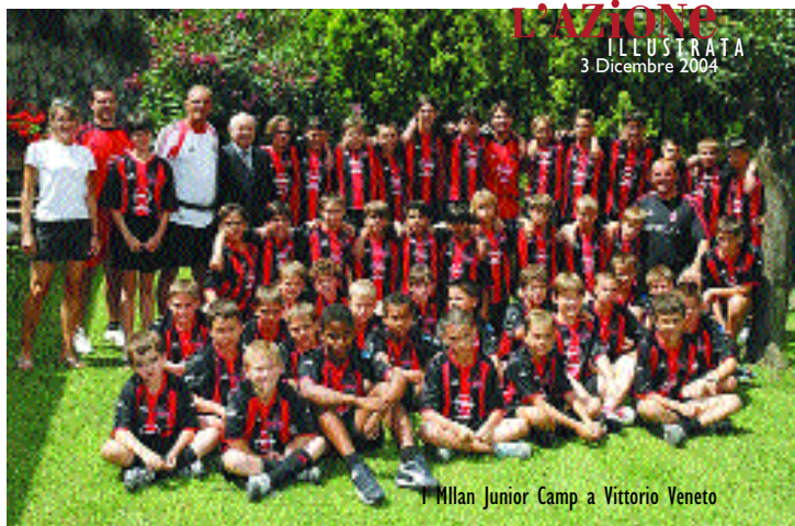
Il Milan Junior Camp a Vittorio Veneto

La società con il Milan, che gestirà le strutture sportive ed