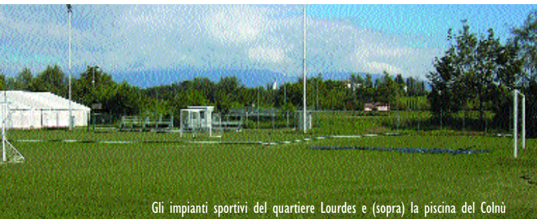
Gli impianti sportivi del quartiere Lourdes e (sopra) la piscina del Colnù

"Il 6 marzo è prevista la Treviso Marathon; a maggio la Coppa del mondo maschile di scherma (individuale e a squadre), ad aprile-maggio il torneo esordienti e giovanissimi di calcio; a maggio lo stage nazionale aikido, a giugno un evento sportivo di solidarietà con la Nicco (nazionale italiana calcio olimpionici)".