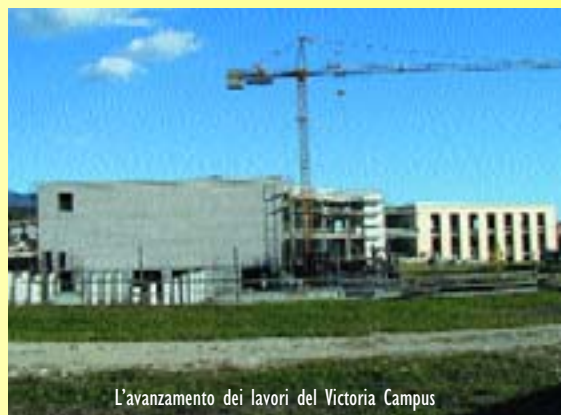
L'avanzamento dei lavori del Victoria Campus

Nel frattempo Victoria Sport si sta muovendo per trovare gli "inquilini" dei vari servizi: dal centro benessere agli spazi commerciali ed alla ristorazione. L'intento è quello di attendere di aver stipulato questi contratti per