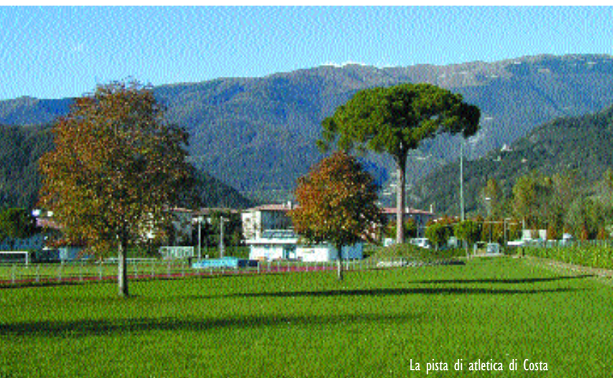
La pista di atletica di Costa

Quanto alle piscine, la società Nottoli Nuoto, che ha in gestione l'impianto, sta apportando importanti lavori all'impianto. Presto provvederà ad un ampliamento (una nuova piccola vasca coperta, a sud dell'attuale, da dedicare all'aquagym e a corsi particolari, lasciando così al nuoto vero e proprio la vasca grande, ndr) sistemando anche il solarium esterno, ossia il selciato che d'estate tanti vittoriosi utilizzano