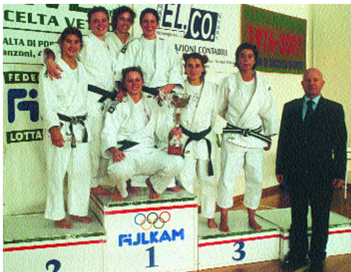
Le "ragazze terribili" del Judo Vittorio Veneto

Anche le medaglie ed i titoli nazionali individuali abbondano. Tra l'anno scorso e quest'anno, le sole Judoka Vittoriesi hanno vinto ben quattro medaglie d'oro ed altrettanti titoli Italiani, una medaglia d'argento, una di bronzo ed