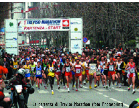
La partenza di Treviso Marathon

per passare le loro giornate di vacanza.”