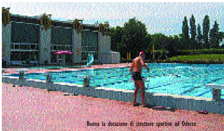
Buona la dotazione di strutture sportive ad Oderzo

strutture. Perché se non ci sono impianti sportivi le associazioni non trovano risposta alle loro esigenze". Oltre a ciò, in che modo il Comune sostiene lo sport? "Ogni anno viene stanziata una cifra in bilancio per la diffusione della pratica sportiva attraverso le manifestazioni anche a livello regionale e nazionale. Abbiamo avuto ad Oderzo la prima edizione di un campionato giovanile di calcio, il campionato nazionale di bocce, importanti gare di pattinaggio e di ciclismo. Ci sono poi i contributi alle associazioni affinché possano sostenere le spese di gestione". Dunque a Oderzo lo sport è molto vissuto... "Come ho sempre detto, l'educazione fisica spetta alla scuola. Lo sport è qualcosa che va oltre, implica l'acquisizione di altri valori, come la necessità di allenarsi per ottenere un risultato, l'apprendere le regole del gioco, del saper vincere ma anche