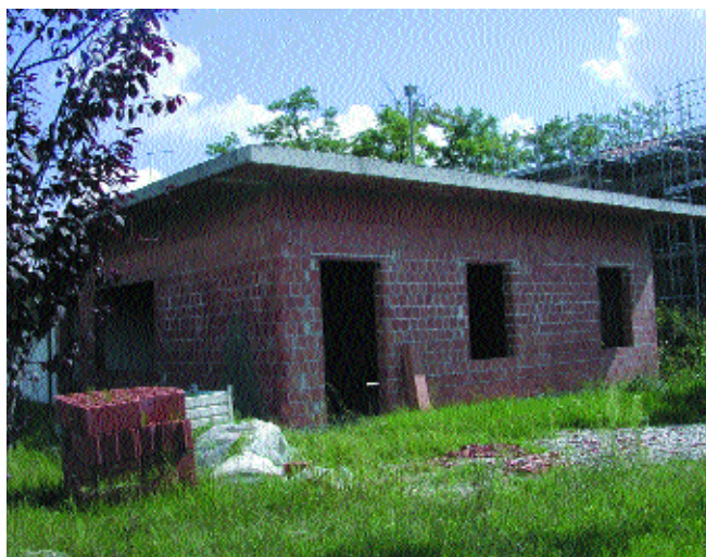
In alto: le ex scuole elementari di Camino, sopra il centro sociale La Fontana di Rustignè

A Piavon è in dirittura d'arrivo c'è il centro sociale realizzato dal Comune, finanziato dai soldi degli investitori del parco commerciale. La nuova struttura è stata al centro, lo scorso anno, di vivaci discussioni, l'U.S. Piavon aveva chiesto che venisse realizzato in un luogo più vicino alla strada, diverso dalla collocazione