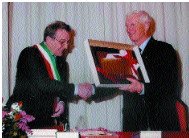
Momento della cerimonia per i 50 anni dell'Avis di Oderzo