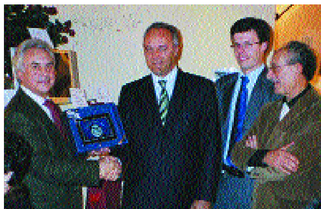
Un momento sociale degli "Amici del Cuore" di Motta di Livenza