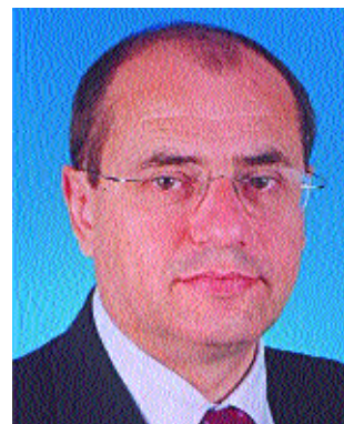
Sopra il Sindaco Graziano Panighel sotto l'assessore Romano Astolfo

rappresenta il modo in cui una comunità si prende cura di se stessa mettendosi gratuitamente a servizio di chi ha bisogno". Quali gli esempi concreti di associazioni che in questo senso collaborano con l'amministrazione? "Tra i molteplici esempi da citare, me ne viene in mente solo qualcuno che però rappresenta tutti. Penso all'Avis che nei giorni festivi distribuisce pasti a domicilio a molti anziani che non possono muoversi. Oppure all'associazione Anziani e Pensionati che organizza soggiorni climatici estivi in montagna. In questo periodo poi organizza e gestisce l'esperienza dei corsi di ginnastica antalgica e i programmi alle terme di Bibione una volta la settimana. Cito pure la San Vincenzo e la Caritas che hanno costantemente contatti con le famiglie o singoli in diffi-