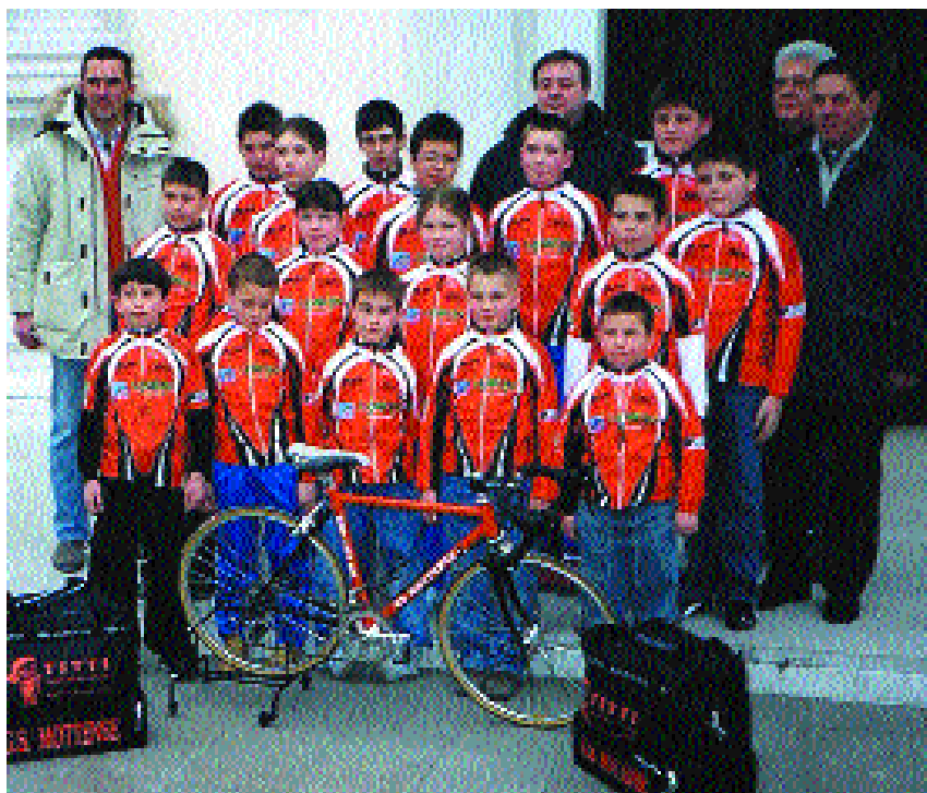
Le giovani speranze del GS Mottense