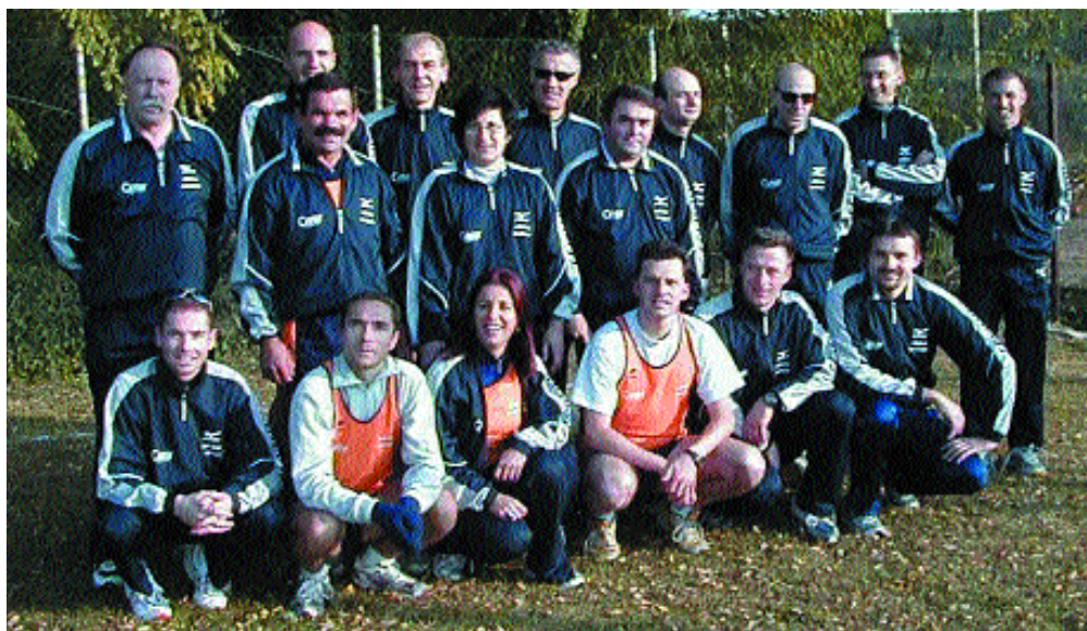
L'associazione Atletica Mottense

chiature radio, nonché di moderni strumenti informatici che consentono la raccolta in tempo reale dei dati climatici locali".