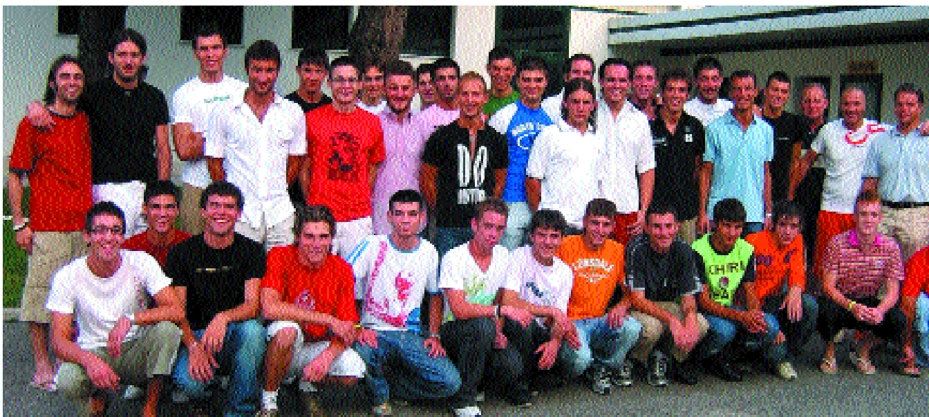
Il raduno precampionato della LiventinaGorghense FM