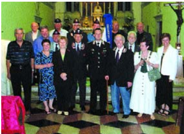
il raduno per il 190° dei carabinieri a Motta