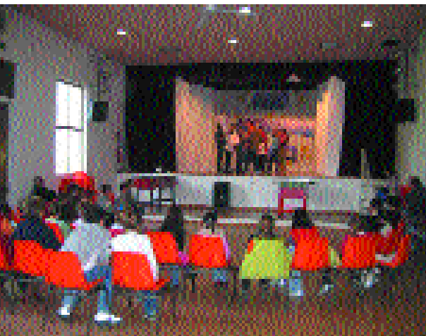
Momento di attività al patronato di Colfrancui

sociazioni. "Come amministrazione ci siamo impegnati parecchio per dotare di centri sociali le varie frazioni. Penso a Rustignè, dove è stato realizzato "La Fontana", a Piavon dove è in dirittura d'arrivo la nuova struttura, a Faè e Fratta dove saranno rea-