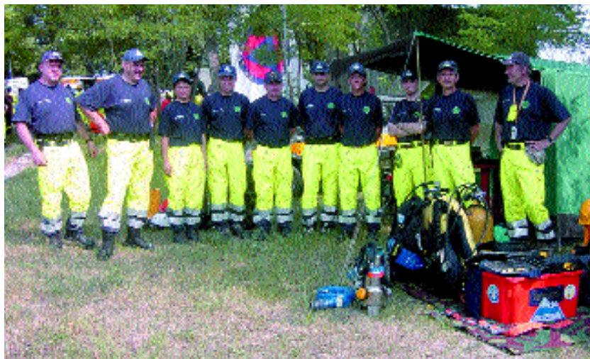
il volontari della Protezione Civile di Motta

cio operativo dei soccorsi stessi in collaborazione con i VV.FF., la Provincia, il Genio civile ed altri enti preposti. Il Nucleo ha curato l'allestimento, l'arredamento, la dotazione di apparec-