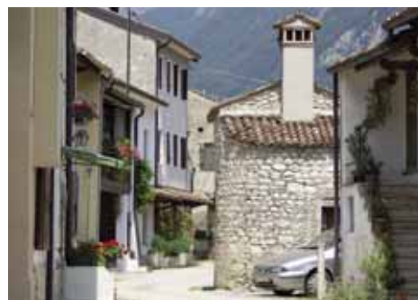
Il borgo nei pressi delle sorgenti del Meschio

Agenzia Servizi Formativi delle Province di Venezia e Treviso