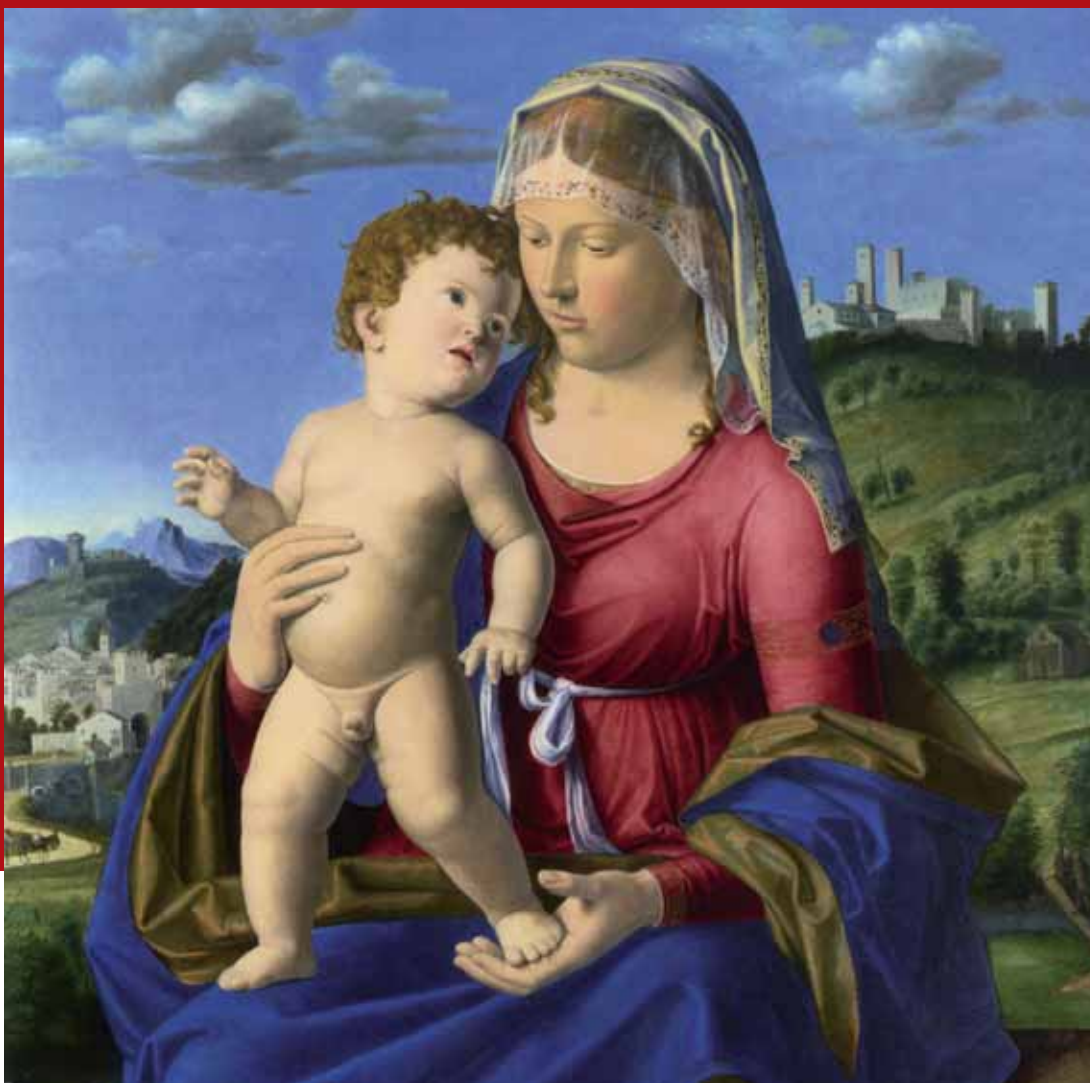
Gian Battista Cima, Madonna col Bambino , Londra, National Gallery.