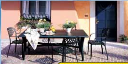
MOBILI DA GIARDINO