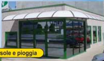
CUPOLINI per sole e pioggia